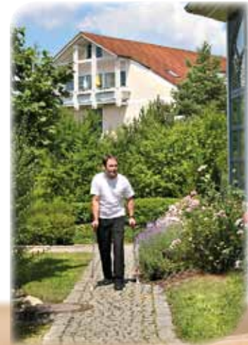
Bewegung im großzügigen Außenbereich