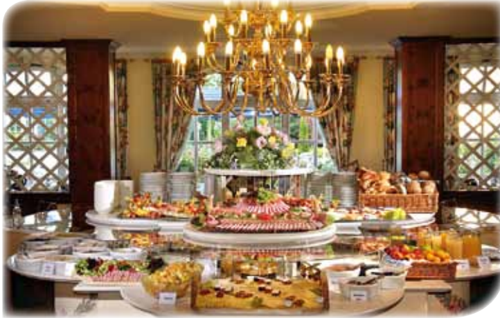
Reichhaltiges Frühstücksbuffet sowie bedarfsgerechte Ernährung mit verschiedensten Kostformen.